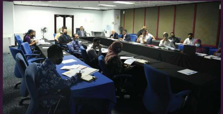
Mesyuarat kali ini mengambil tempat di PKNP