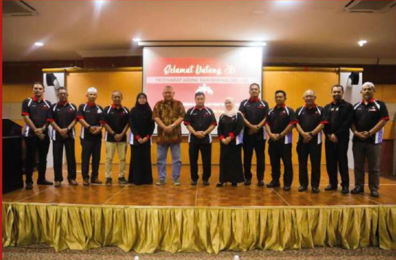
TKPE (Pembangunan) bergambar bersama Anggota Lembaga Koperasi Kakitangan Kumpulan PKNP Berhad selepas upacara perasmian

Kuantan, 19 Jun - Seramai 255 orang ahli Koperasi Kakitangan Kumpulan PKNP Pahang Berhad (Koop PKNP) telah menghadiri Mesyuarat Agung kali ke - 28 pada 19 Jun 2022.