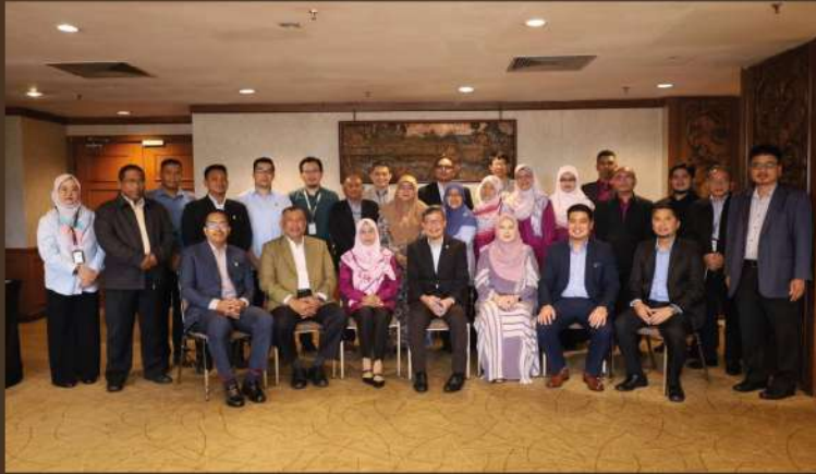
Pengurus Besar PPES bergambar bersama peserta kursus yang hadir

Kuantan, 15 Jun - Memahami keperluan pasaran masa kini dan mengambil langkah wajar dan tepat bagi persediaan pasaran tenaga masa depan antara fokus program Preparing Workforce of the Future, the Competing Forces Shaping 2030 yang berlangsung