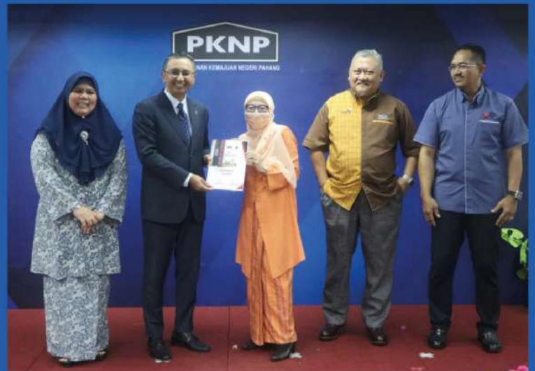
Bahagian ICT julang tempat pertama bagi kategori bahagian/unit

Program yang dijalankan bermula 4 April hingga 3 Jun 2022 ini disertai oleh 155 orang anggota pekerja PKNP dan anak syarikat PKNP. Seramai 79 anggota pekerja PKNP berjaya mencapai berat badan ideal.