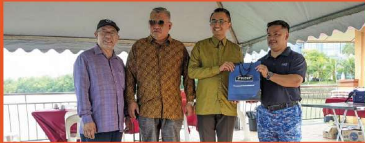
Kursus selama dua hari ini menjadi landasan kepada anggota pekerja yang terlibat untuk mendalami ilmu menyelamat asas.