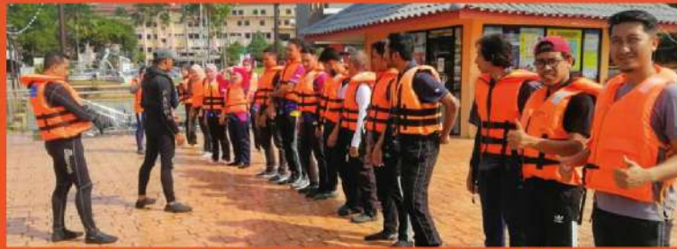
Para peserta diberikan taklimat sebelum aktiviti air dijalankan.