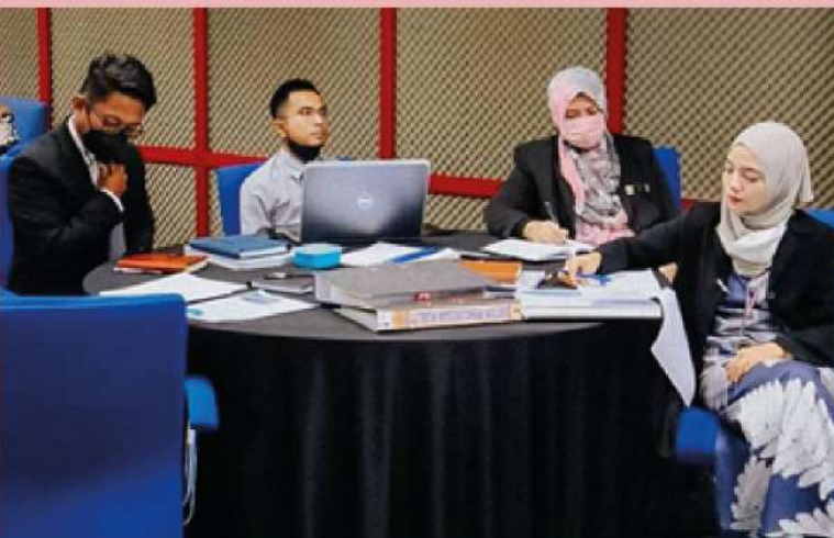
Kursus selama tiga hari ini menjadi platform kepada para pegawai untuk memahami dan mendalami selok - belok sebagai juruaudit dalaman PKNP

Kuantan, 12 Mei - Seramai 29 pegawai Kumpulan Pengurusan & Profesional PKNP telah menghadiri kursus Audit Dalaman ISO 9001:2015 dan ISO 37001:2016 bermula pada 9 Mei sehingga 11 Mei 2022 di Dewan Seminar EDC, Tingkat 3, Kompleks Teruntum.