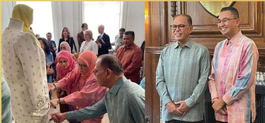
Antara tetamu kehormat yang hadir ke London Craft Week

London, 10 Mei - Ketua Pegawai Eksekutif PKNP, Yang Hormat Dato' Mohd Faizal bin Jaafar telah dijemput menghadiri perasmian London Craft Week pada 9 Mei 2022 di bangunan Suruhanjaya Tinggi Malaysia di Belgrave Square, London, United Kingdom.