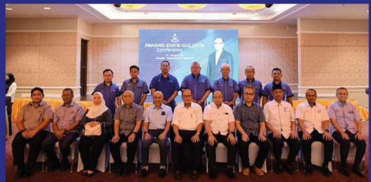
Delegasi PKNP mengabadikan kenangan bersama YAB. Menteri Besar Pahang dani barisan Exco Negeri Pahang

Setelah seharian para delegasi terlibat dalam persidangan, keesokkannya pada 20 Ogos 2022 telah diadakan pertandingan boling dan golf di antara anak syarikat kerajaan Negeri Pahang.