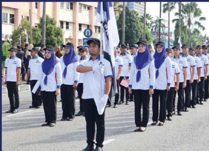
Hari Kemerdekaan peringkat Negeri Pahang disambut meriah dengan kehadiran ramai pengunjung yang ingin mengambil peluang menyaksikan hari bersejarah ini

Kuantan, 31 Ogos - Seramai 35 anggota pekerja Perbadanan Kemajuan Negeri Pahang (PKNP) telah menyertai perarakan sempena Hari Kebangsaan ke - 65 peringkat Negeri Pahang yang berlangsung di Padang Majlis Bandaraya Kuantan (MBK 4), Kuantan, Pahang Darul Makmur.