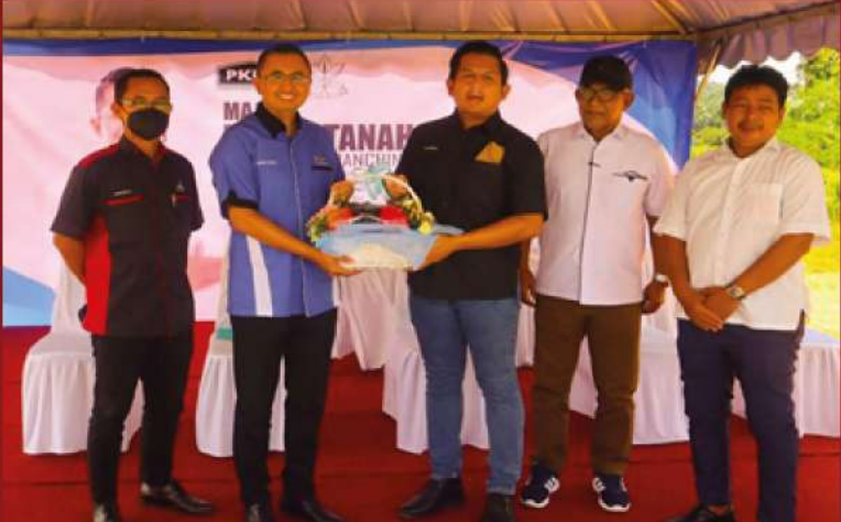
PKNP merakamkan ucapan tahniah di atas kesudian YB. Dato' Indera Mohd Shahr hadir dan merasmikan majlis pecah tanah

Panching, 28 Ogos - YB. Dato' Indera Mohd Shahr bin Abdullah, Timbalan Menteri Kewangan 1 merangkap Ahli Parlimen Paya Besar, Kuantan telah merasmikan Majlis Pecah Tanah Projek Pusat Pertumbuhan Desa (PPD) Panching, Kuantan kira - kira jam 10.30 pagi.